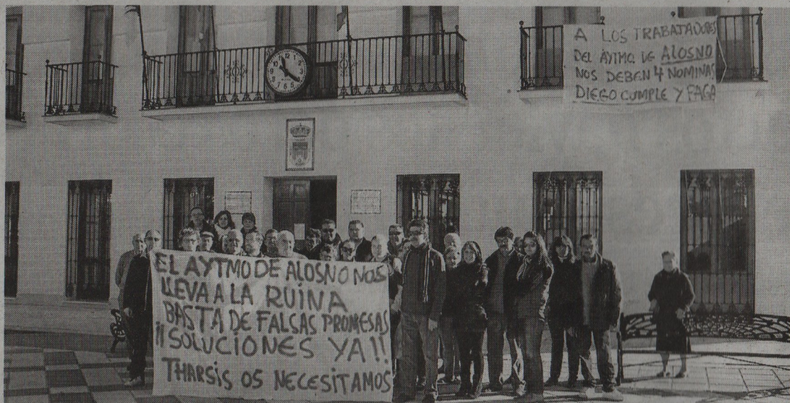
Los empleados municipales de Tharsis iniciaron ayer sus protestas.

La situación “está llegando a límites insospechables para muchos padres y madres de familia –prosigue Vázquez– que están desesperados y que están recurriendo en muchos casos a la ayuda de sus familiares, vecinos y amigos para tirar para adelante”. No obstante, asegura, “los hay que no tienen ni esa posibilidad, que son los que peor lo están pasando”.